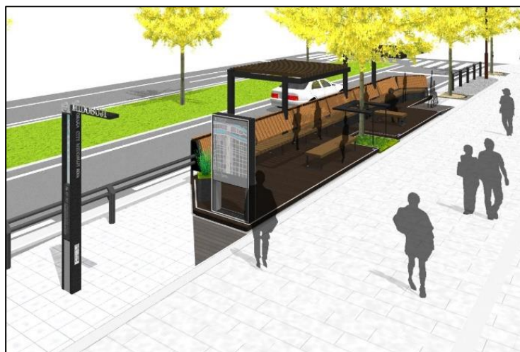
（図表）昨年度に検討したパークレットに設置する 地域情報案内板イメージ

大阪市中央区今橋4丁目1番地先 御堂筋・淀屋橋三井ビルディング前パークレット内 1基