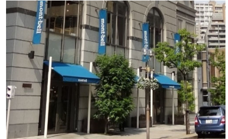
適度な数、間隔で設置されたバナーフラッグ、先端に店舗名称が記載されたオーニングの例