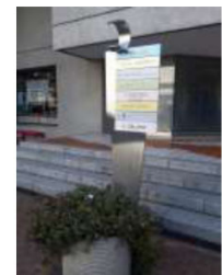
植栽ポットをあしらったデザイン