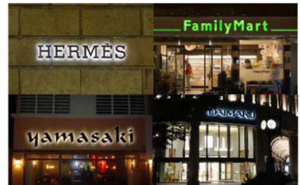
切り文字やバックライトを用いてデザインに配慮した、スマートで表情のあるサインの例。