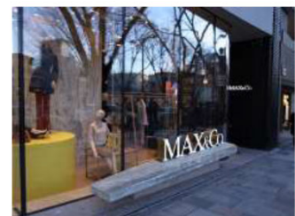
まちなみを演出するデザイン

※御堂筋デザインガイドライン対象区域を除く、御堂筋及び御堂筋に面する敷地（区間／大阪駅前～土佐堀通）に関する基準を記載 他の重点届出区域（中之島地区に面する建築物・土佐堀通地区）と重複する敷地は、双方の基準を参照する