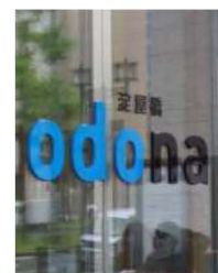
ガラス面の外側の設置例