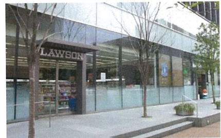
オフィスビルの意匠にあわせ企業カラーを抑える、切文字型のサインを採用する、窓面広告を掲示しない等の配慮をしているコンビニエンスストアの例。