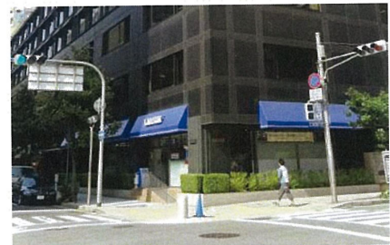
まちなみに配慮し、日よけテント型のサインを採用しているコンビニエンスストアの例。テントの色は、企業カラーの明度・彩度も落としています。