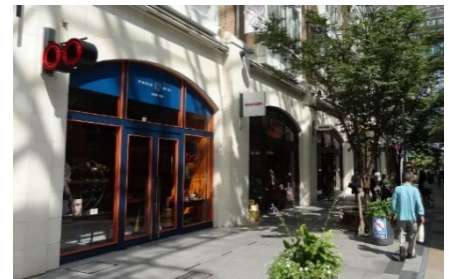
まちを彩る袖看板。突出し幅や位置を揃え、連続的に配置されている例