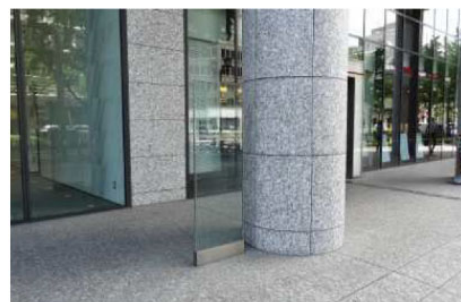
テナント名を集約して表示している例。