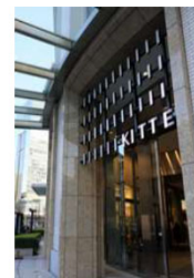
建物の装飾と一体化したデザイン