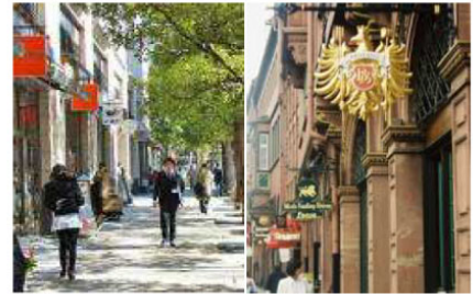
掲出方法にルールを持たせた、統一感のあるテナントのサインの例。