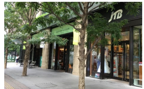
掲出位置が揃い、まちなみとしての連続性に配慮された低層部壁面広告の例