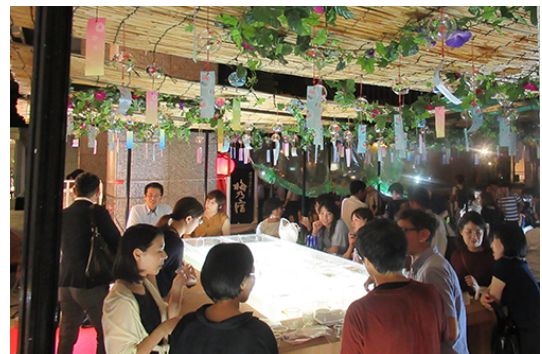
8/30 御堂筋天国 夏まつり