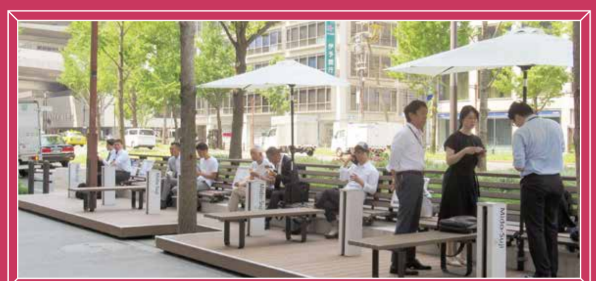
10月25日(金)・26日(土) 本町ガーデンシティ前の休憩施設「パークレット」において、「芝生のカーペット」が登場!また、「コンサート」や食材の産地にこだわった「キッチンカーの出店」を行います。