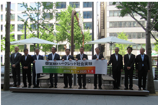
8/1 御堂筋パークレットオープニングセレモニー