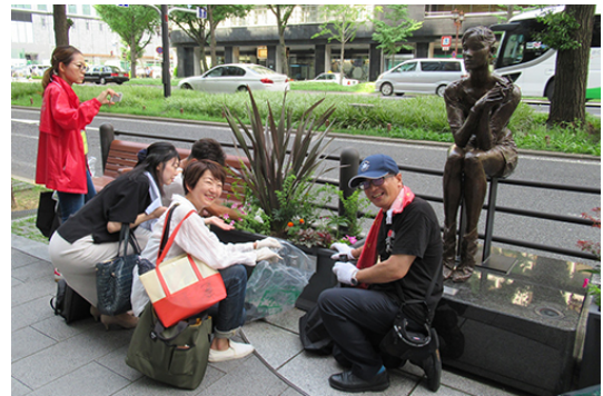
7/25 コンテナガーデン植えたし